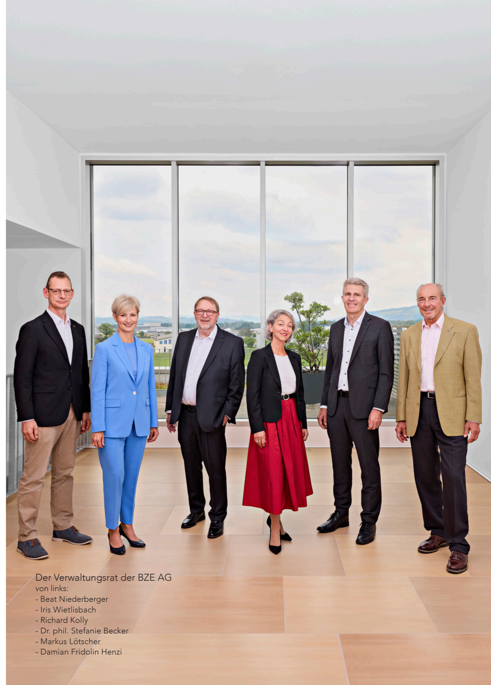
Der Verwaltungsrat der BZE AG